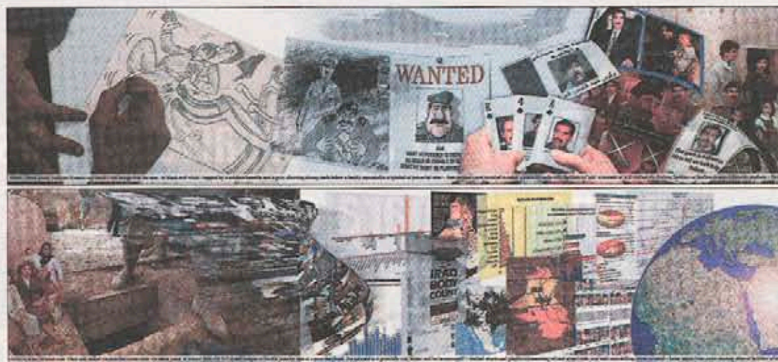
El trabajo MetaMap Saddam Hussein 1937-2007 .

IMAGINARY MUSEUM: http://imaginarymuseum.org